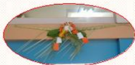
ボランティアの池田さん作