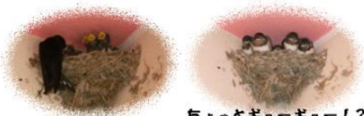
ちょっとキューキュー!?