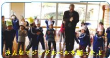
みんなでジャグレベルを踊ったよ