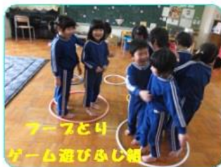
アープと4 ゲーム遊びふじ組