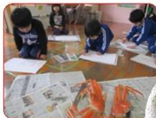
カニをかいだよ！ ゆり組

TEL・FAX 08512-2-0510 携帯電話 090-5261-7064 ホームページ http://www.kyousei.gr.jp/