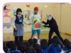
「ウン知有教室」参加

毎日元気に過ごすため、いいウンチを出すための生活習慣についてわかりやすく教えてもらいました。