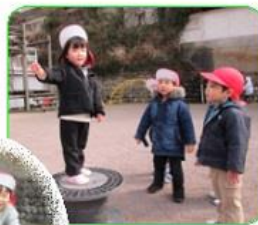
園庭遊び さくら組