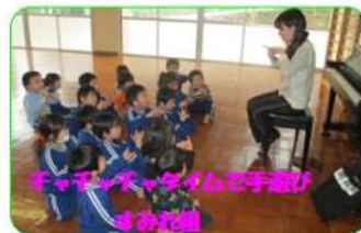
ドーナツゲームで手遊び すみれ組