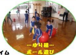
…ゆり組… ボール遊び