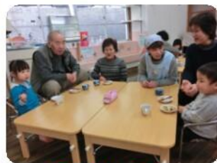
「たこやきパーティー」 おいしかったよ!

TEL・FAX 08512-2-0774 E-mail nyuuji@estate.ocn.ne.jp ホームページ http://www.kyousei.gr.jp/ 携帯電話 090-7778-0774 (保育所) 090-5261-7088 (通園バス) メール nyuujihoikusho@docomo.ne.jp