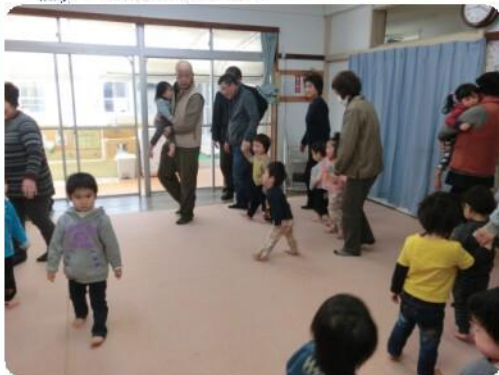
「表現あそび」 おじいちゃん、おばあちゃんも 一緒にしたよ!