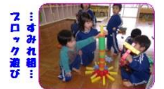
…すみれ組… ブロック遊び