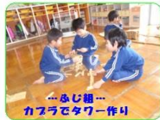
…ふじ組… カプラでタワー作り