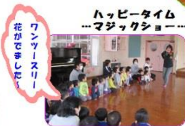
ハッピータイム …マジックショー…