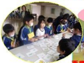
西郷小学校一日入学ふじ組