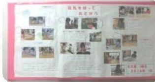
保育所の玄関に掲示してありますので、ご覧ください

平成28年度 入所申込みを受け付けています 書類の提出期限が2月10日(水)となっています。申し込みをされる方は、保育所又は役場までお願いします。 乳児保育所では、育児休暇明け、産後休暇明けの入所の予約受け付けも行っておりますのでお気軽に声をかけてください。