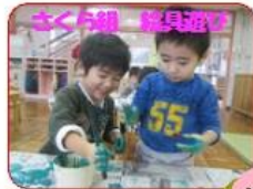
さくら組 粘土遊び