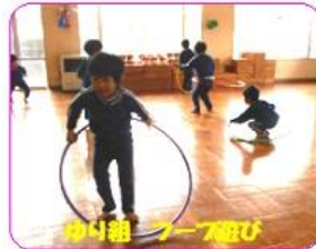
ゆり組 フープ遊び