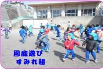
園庭遊び すみれ組