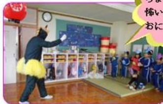
ちょっと 怖いけどー おにはそと～