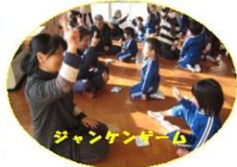
ジャンケンゲーム

大好きなおじいさんおばあさんと一緒にゲームをしたり、おやつを食べたり楽しく過ごしました。いろいろお世話になり、ありがとうございました。