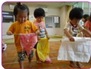
さくら組洗濯遊び