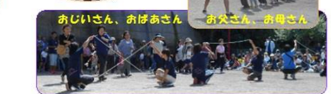
おじいさん、おばあさん