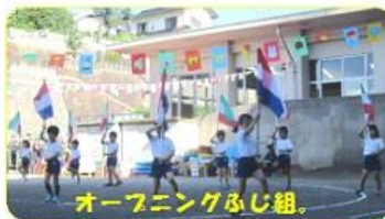
オープニングふじ組。

第二保育所、第二夜間保育所のお友だちと一緒に稲刈りをしました。初めて持つカマを上手に持って丁寧に刈り取りました。おいしいお米になりますように…。