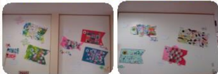
5月、年齢ごとで作ったこいのぼりの壁面です

ひよこ、もも組は、シール貼りや手型押し、さくら組は、なぐり描きやのりづけ、すみれ、ゆり、ふじ組は模様を描いたり、切ったり貼ったりして自由に楽しみました。