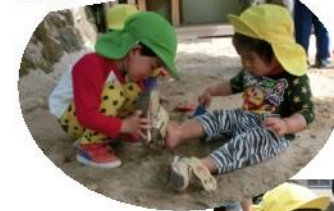
「くつ、はかせてあげるね」