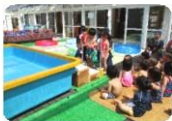
1、2歳児 プールびらき

8月も友だちと関わりながら、水あそびや泥んこあそびなど夏のあそびを楽しみたいと思います。