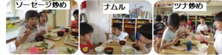
厨房から豆苗の切った株をもらって水栽培をし、収穫してクッキングしました。特有の香りを感じながら喜んで食べました。