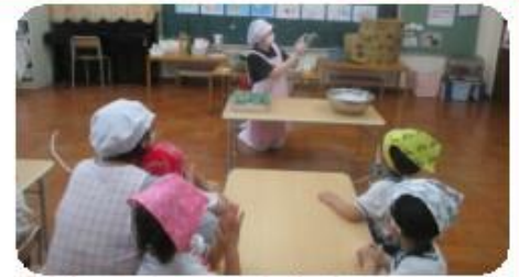
「給食の先生って すごいね!」「じょうず〜」思わず拍手が沸き起こりました。厨房と保育のよい交流の機会になりました。

旧暦の端午の節句に、昔から伝わる笹巻きづくりをしました。いつもなら、おばあさま方に保育所に来てもらい作るところを見せてもらうのですが、今年は、厨房の先生が子どもたちの目の前でデモンストレーションをし、その後保育士と子どもたちで作りました。すみれ組は団子を笹の葉で挟むこと、ゆり組とふじ組は、笹の葉でくるんで紐で巻くことを保育士と一緒に経験しました。上手にできなくても、自分たちで作ったうれしさを感じ、得意顔になっている子どもたちでした。笹のいい香りのお団子を、おいしくいただきました。