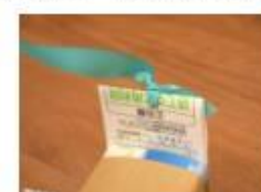
ボールでも代用できます