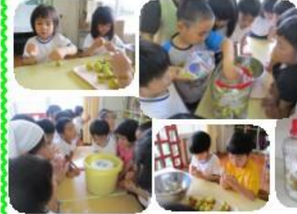
梅においをかいで、「いいにおい〜」と、にんまり顔でした。梅のへそをとり、楊枝で穴をあける作業を根気よく頑張りました。氷砂糖と交互に入れてシロップ、塩をまぶして梅干しへ…。時間をかけて出来上がることを知らせると、「楽しみ〜」とワクワクした様子でした。出来上がりはいつかな…♪