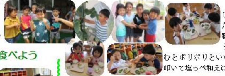
「おおきいね」「デクデクしてる」と、みんながさわりたくて取り合いになるほど収穫を喜びました。新鮮なきゅうりは、みずみずしくて、噛むとポリポリといい音がしました。スライスや叩いて塩っぺ和えにして、おいしく食べました。