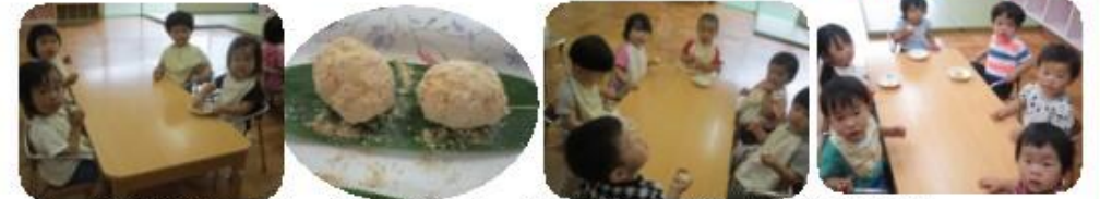
未満児クラスは、笹の葉にのった“きなこおにぎり”でした。大喜びで、あっという間にペロリでしたよ。