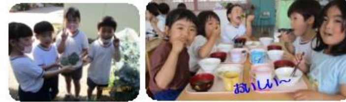
「これ、食べてもいい?」大きなブロッコリーを見つけ、ふじ組さんが嬉しそうにしています。収穫してすぐにボイルして食べました。「いい味〜」と、にっこりにこでした!