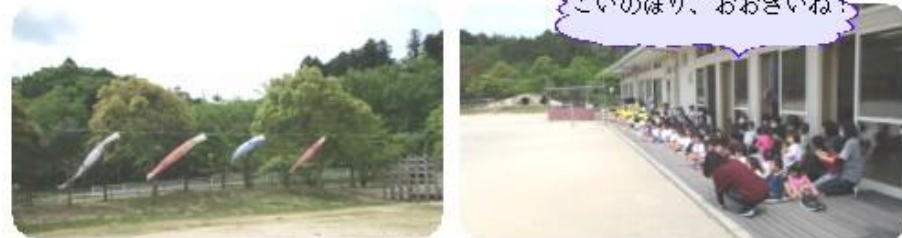
こいのぼり、おおきいね！

「やねよ〜り た〜か〜い こいの〜ぼ〜り〜♪・・・」 子どもたちの元気な歌声に合わせて、園庭にこいのぼりがあがりました。風に吹かれて優雅に舞うこいのぼりのように、元気溢れる子どもたちでいてほしいです。