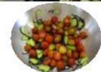
トマトときゅうりの 塩昆布和え