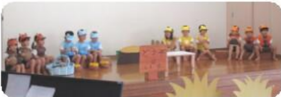
(すみれ組) 劇あそび「どうぞのいす」