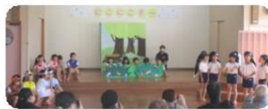
劇あそび「やさしいかいじゅう」