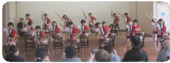
(ふじ組) 太鼓「四方八方肘鉄砲」