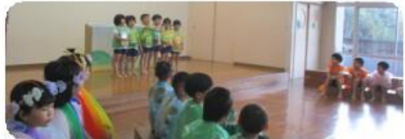
(ゆり組) 劇あそび「夕日が見える丘公園へ行こう」